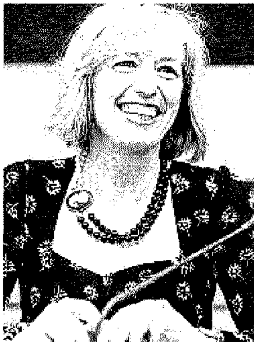
IL VIA Il ministro Giannini ha assicurato il finanziamento aggiuntivo per Imt di Lucca